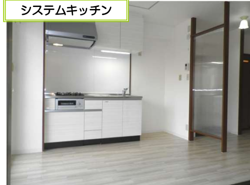
システムキッチン