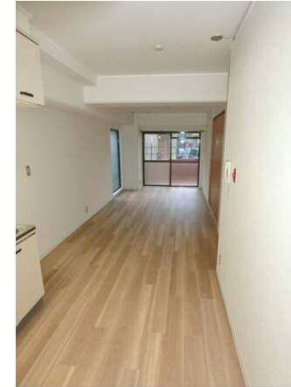
※現況を優先とします。