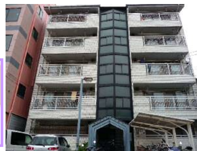
※写真は同一間取りの別室です（現況優先）