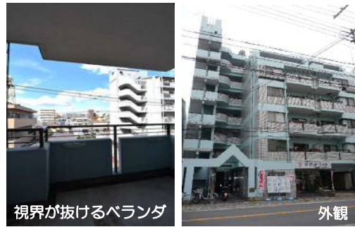
※写真は前回募集時のもの。現況優先とします。