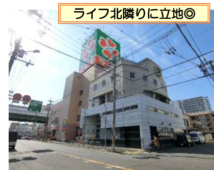
ライフ北隣りに立地◎