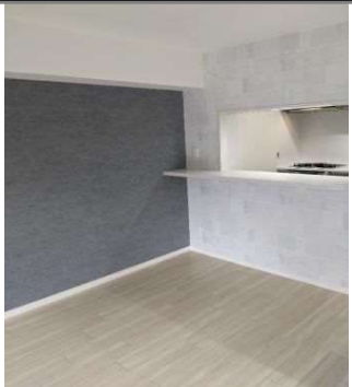
カウンター付き対面キッチン