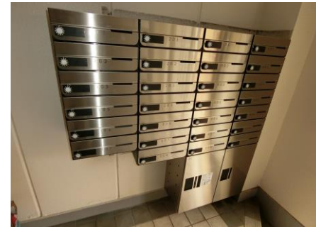
留守時に便利な 宅配ボックス★