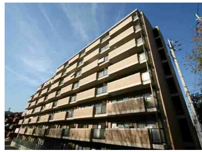
リノベーション♪明るい南向き！

★リノベーション南向き3LDK★ 法人契約にも最適◎ リノベーション！3口ガスシステムキッチン・追焚機能付ユニットバス◎ 人気の独立型&カウンター付き対面システムキッチン！