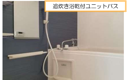
追炊き浴乾付ユニットバス