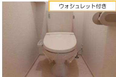
ウォシュレット付き