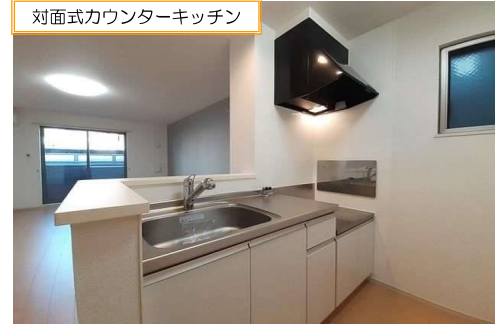
対面式カウンターキッチン