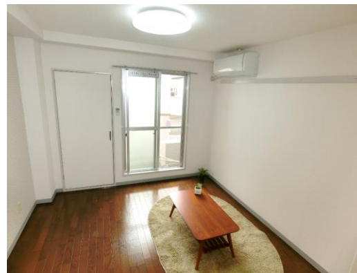
※写真は別室参考です。