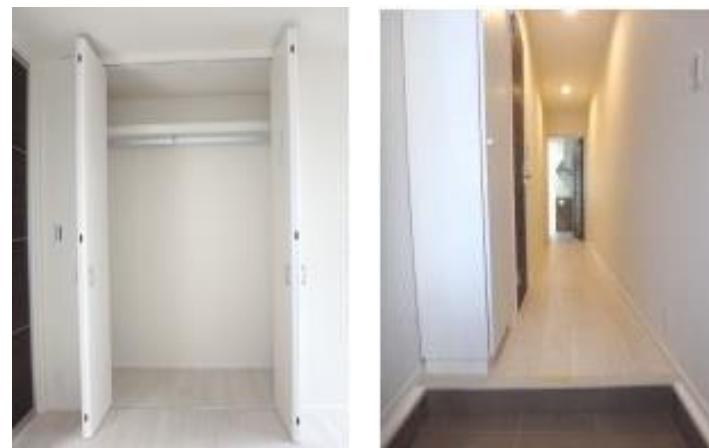
※一部別室の写真を使用しています