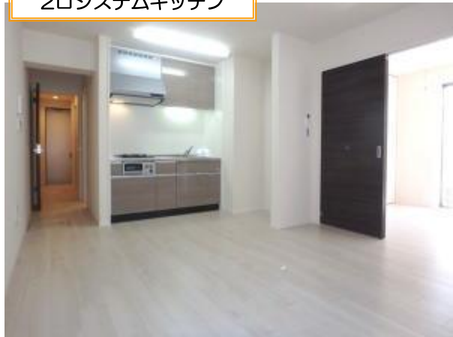
2ロシステムキッチン