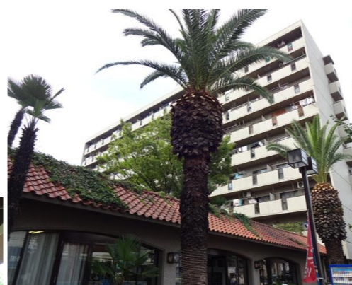
南欧風のスタイリッシュな建物