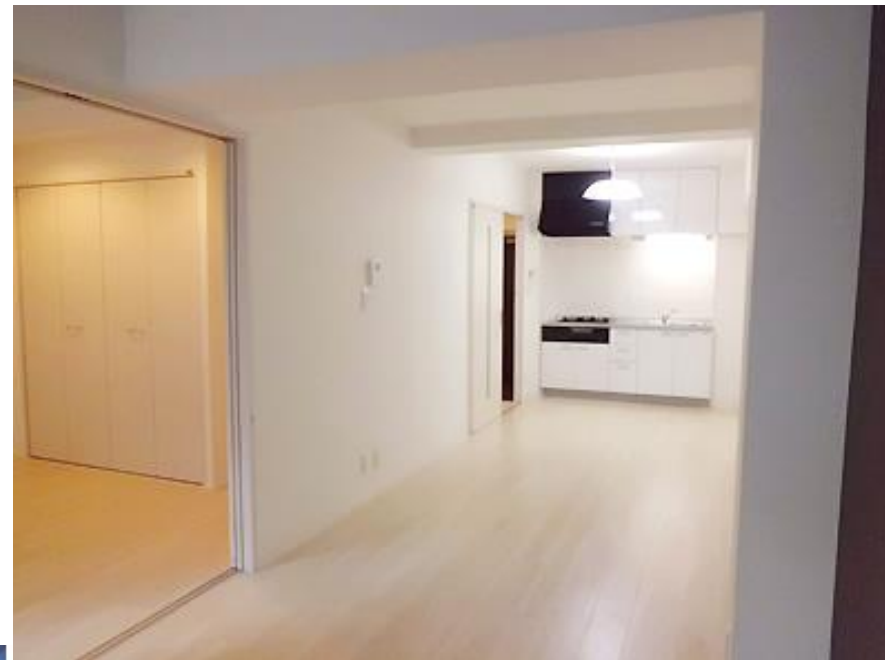
※写真は前回改装時のものです。現況優先となります。