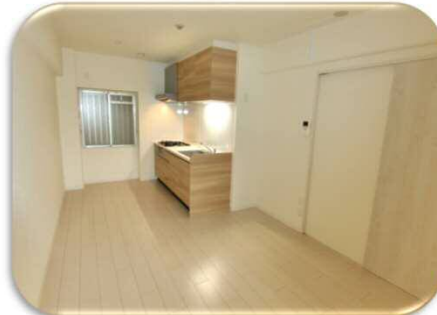
3口システムキッチン