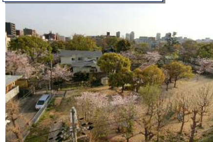
バルコニーから公園ビュー！

長堀鶴見緑地線「玉造駅」より徒歩2分！ 上層階・南向き公園ビューのお部屋！春は桜が満開です♪