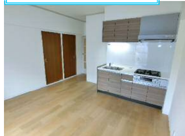
新品！システムキッチン