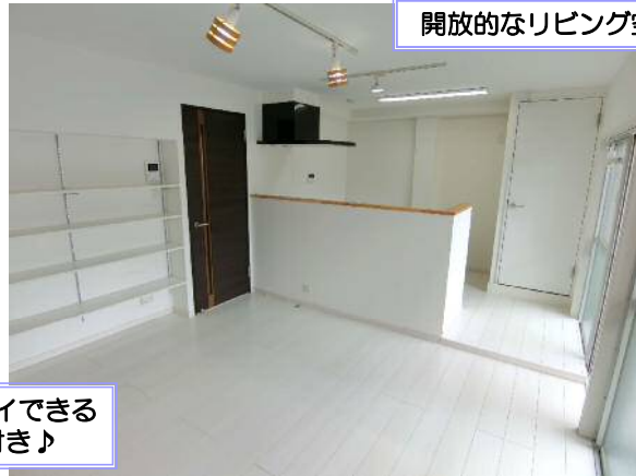
ディスプレイできる 可動棚付き♪