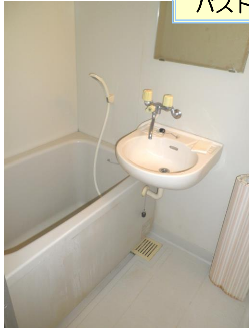
バストイレセパレート