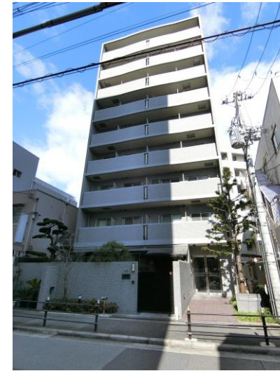
梅田スカイビル近隣 大阪駅へ徒歩圏内♪