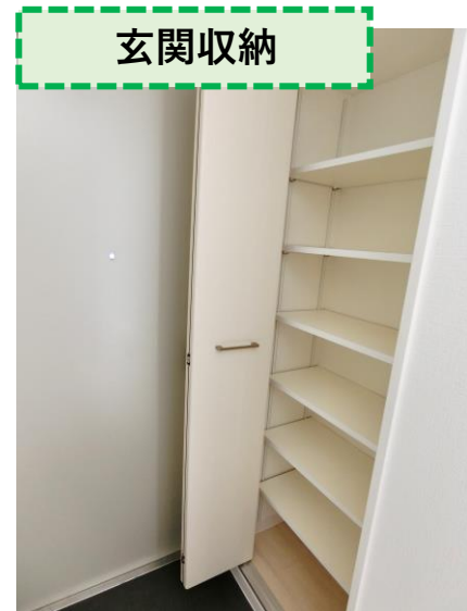
※別室の参考写真です。間取りが異なります。