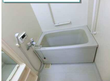
追炊き機能付き浴室