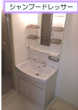
シャンプードレッサー