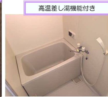
高温差し湯機能付き