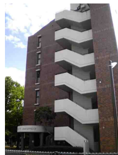
室内フルリノベーション済！明るい南東向き♪