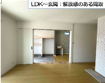
LDK～玄関：解放感のある間取