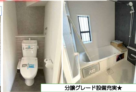
分譲グレード設備充実★