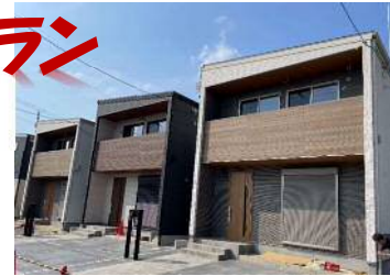
収納たくさん! 広々土間プラン

希少な新築戸建賃貸★子育て世帯におすすめ♪ ゆったり駐車スペース付★2台可 (普通車1台+軽自動車1台程度) 分譲グレードの設備★ワイドシステムキッチン・浴室乾燥機付ユニットバスなど充実◎ 抜群の収納力★広々土間プラン+玄関収納&パントリー&WinCL!