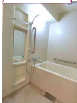
高温差し湯機能付