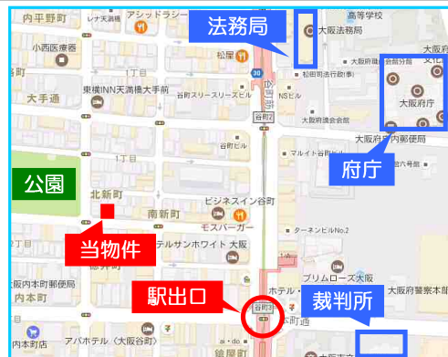
近隣に緑豊かな公園あり♪