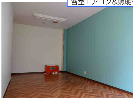
各室エアコン&照明付(写真は別室です)