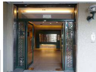
モダンな エントランス♪