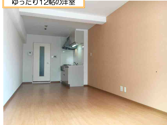
ゆったり12帖の洋室