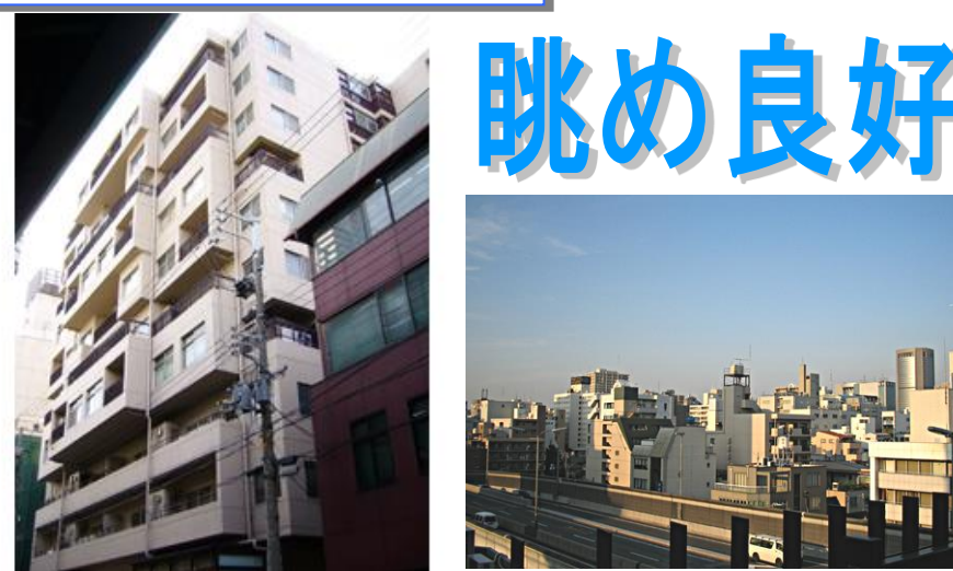
外観とバルコニービュー

各線「南森町」「北浜」駅から徒歩6分！ 上層階で眺め良好♪対面カウンター付システムキッチン♪ SOHO利用可能！事務所・店舗ご相談下さい！（エステ相談可）