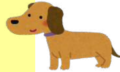
駅近かつのどかな立地

公園横のどかな住宅街に立地の2階建て貸家♪ 戸建ならではの独立感と広さが魅力！中庭つき♪ ★ペット小型犬1匹まで相談可（敷金1ヶ月分要） ★SOHO利用相談可（業種による）