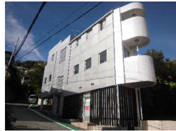
エントランス電子錠付