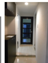
既設玄関のリニューアル