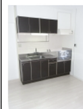
既設キッチンのリニューアル